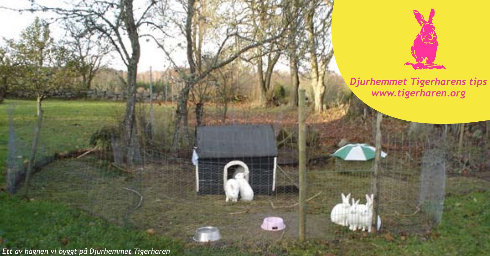
Ett av hägnen vi byggt på Djurhemmet Tigerharen

Djurhemmet Tigerharens tips www.tigerharen.org