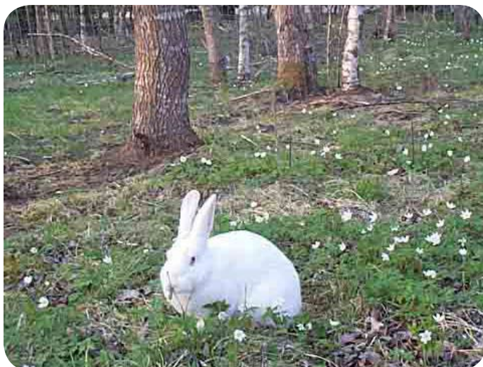
Kaninerna Viveka och Ian i ett av våra hägn