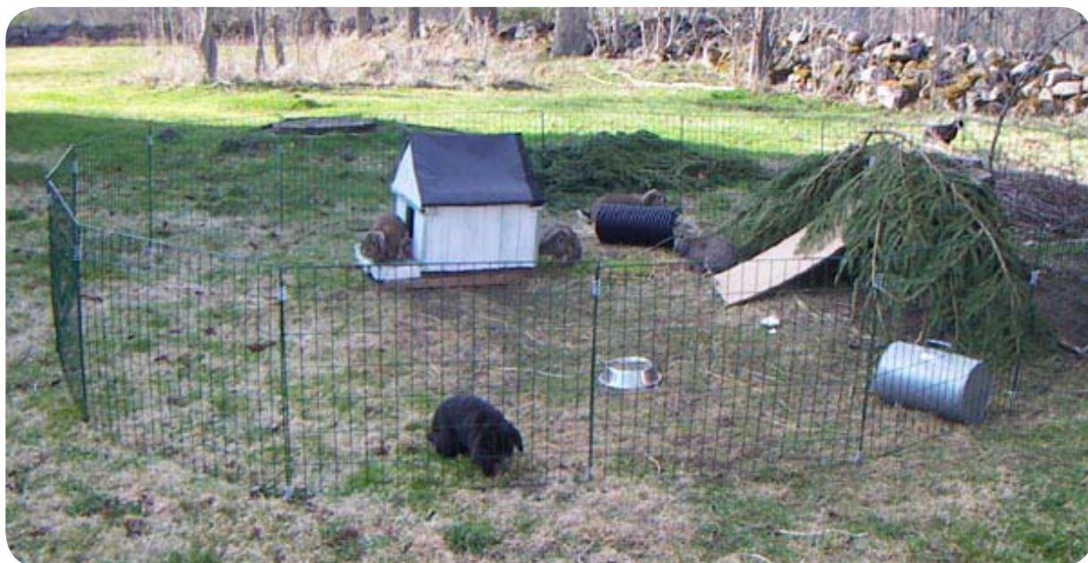
Beteshage av kompostgaller

En hage av kompostgaller är enkelt att få upp, men många kaniner låter sig inte hållas instänga länge av ett sådant innan de gräver sig ut! Däremot kan det fungera som beteshage på sommaren om den flyttas regelbundet, eller på vintern när marken är frusen.